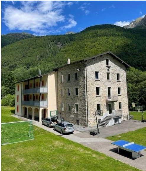
Colonia climatica di Mogno

Direzione Sezionale Gioele Beltraminelli / Clark, capo sezione +41 79 278 98 97